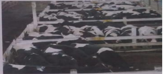
Vista parcial de los corrales en el Mercado de Liniers, donde se ubica la hacienda para su posterior remate.

La cuota Hilton es un cupo de exportación de carne vacuna sin hueso de alta calidad que desde 1979 la Unión Europea otorga a países productores y exportadores de carnes para que sean sus proveedores. El cupo que le otorgó a la Argentina es de 28.000 toneladas anuales. Para ello, la UE estableció que deben ser cortes de carne de vacuno procedentes de novillos, novillitos o vaquillonas que han sido alimentados exclusivamente a pasturas desde su destete, cuyo peso vivo en el momento del sacrificio no exceda los 460 kg, de calidad especiales o buenas, denominados "cortes especiales de vacuno" que estén autorizados a llevar la marca SC ( special